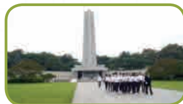
〈현충원 참배 및 봉사활동1〉