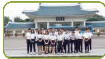
〈현충원 참배 및 봉사활동2〉