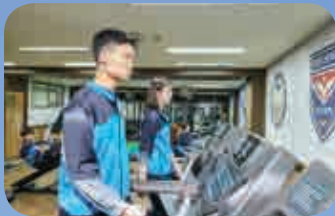
기숙사 방과후 활동