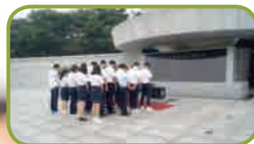
〈현충원 참배 및 봉사활동3〉